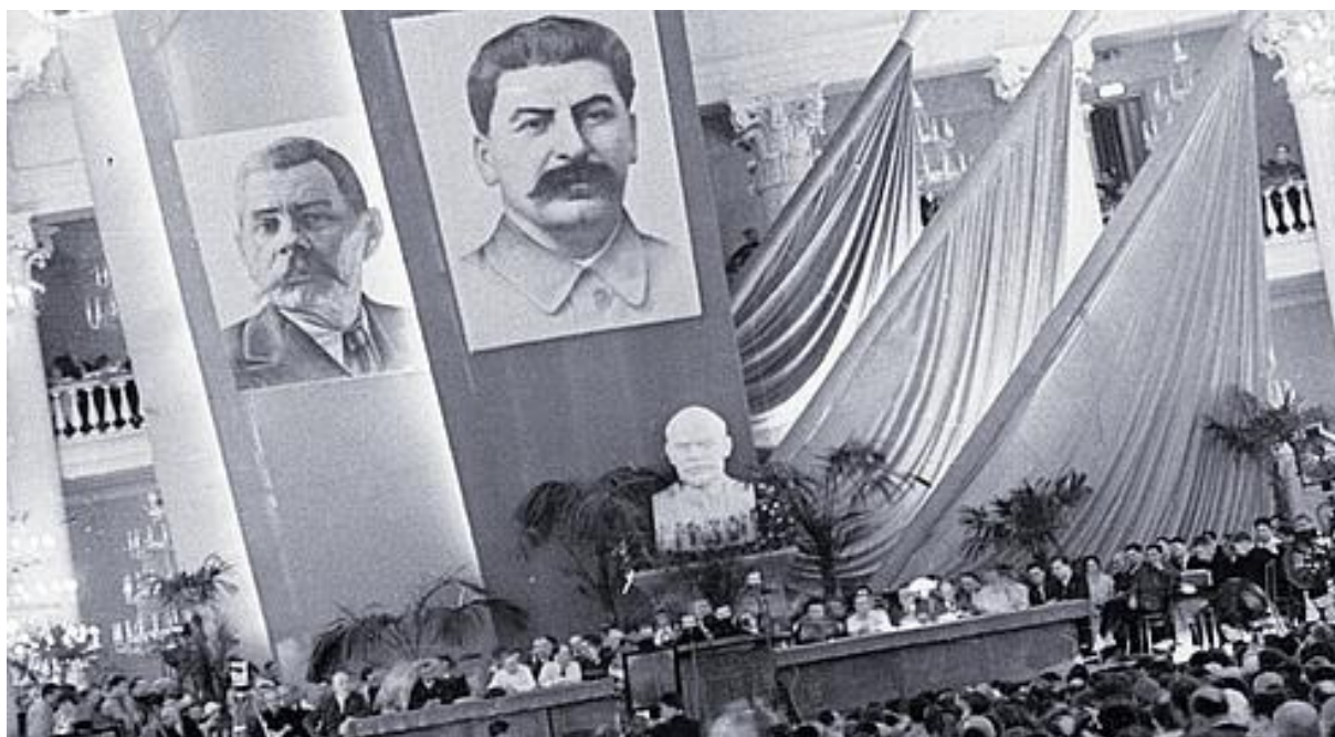
Le premier congrès des écrivains soviétiques