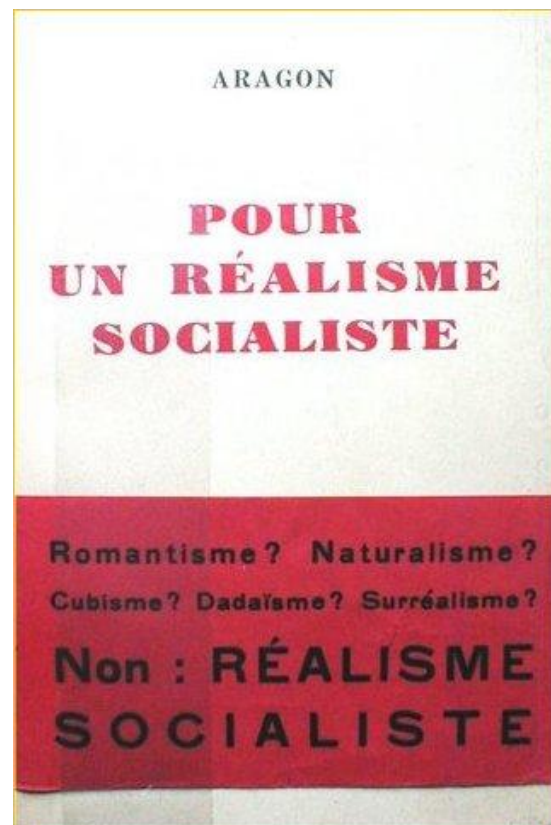
Le n°20 de la revue Commune et la première édition de Pour un réalisme socialiste .