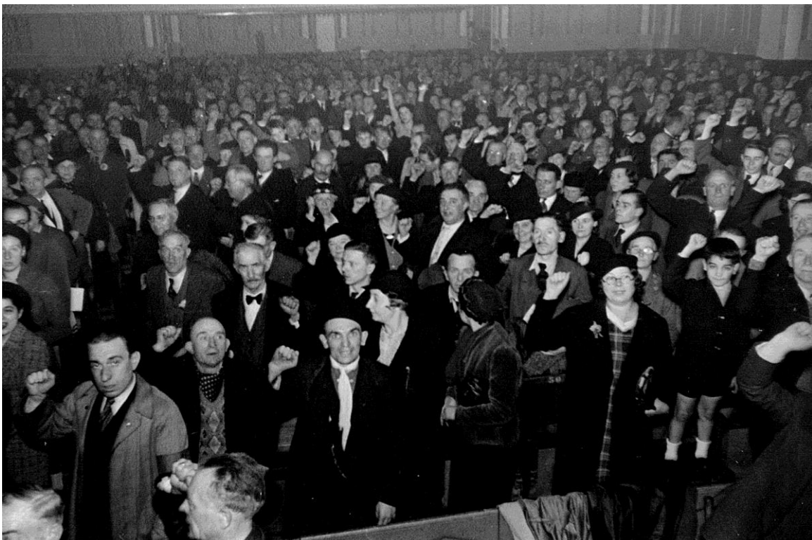
La grande salle de la Maison des Tramwaymen (en 1937, avec Marcel Cachin), cette salle accueille notamment les grands meetings de soutien à l'Espagne républicaine et, à la Libération, le 1er octobre 1944, le grand congrès d'unification du mouvement syndical.